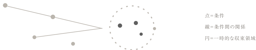
複数条件のゆるやかな収束 / Loose Convergence Before Capture

本稿における「撮影以前」とは、単にシャッターが切られる前の時間を指すものではない。それは、撮影者が対象や空間の変化を察知し、撮影行為に至るまでの判断過程全体を指す。そこには、視覚的な認識だけでなく、距離感、身体の位置、場の沈黙、対象の動き、光の変化、文脈理解、技術的制約、倫理的判断が含まれる。撮影以前とは、写真がまだ写真として成立していないにもかかわらず、すでに写真へ向かう条件が形成されつつある領域である。